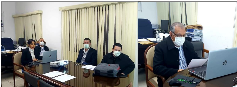
Invitación a Espacio de Preguntas Audiencias Públicas del SINEC Final Gestión 2019 e Inicial Gestión 2020