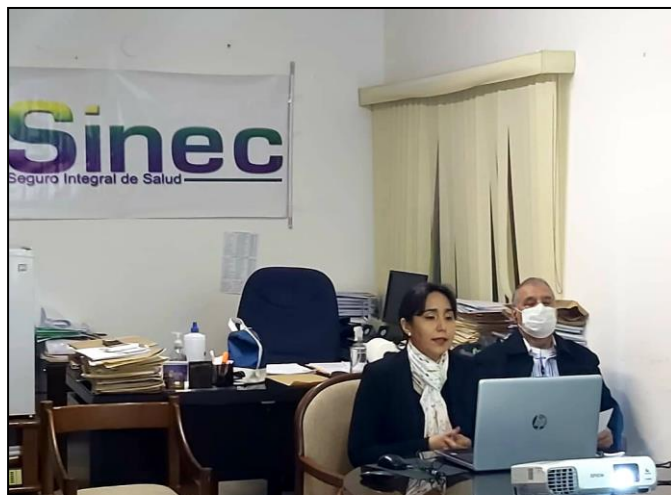
Inicio de la Audiencia Pública Virtual del Seguro Integral de Salud SINEC Aplicación Zoom

Santa Cruz de la Sierra, 09 de julio de 2020